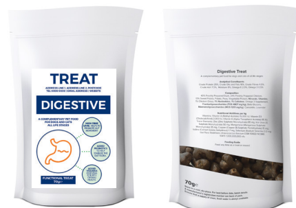
Etikettenproben für Illustrationszwecke